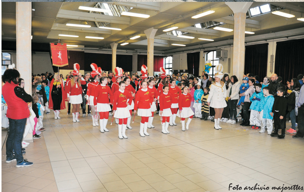
Foto archivio majorettes